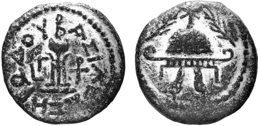
Abb. 2 Münze (Großbronze zu 8 Prutot) des Herodes, geprägt 40 v. Chr. in Samaria.

Herodes und Antigonos um die Herrschaft. Es war auch ein Krieg um die Deutungshoheit, wie man aus der jeweiligen Münzprägung erkennen kann. Beide entwickelten für die Öffentlichkeit ganz eigene Strategien. So propagierte Antigonos auf Münzen seine jüdisch-dynastische Legitimation, die sich auf über 100 Jahre Hasmonäerherrschaft stützen konnte (Abb. 1). Die abgebildete Münze zeigt auf der Vorderseite, umgeben von einer althebräischen Umschrift („Mattathias der Hohepriester“), den Schaubrottisch, und auf der Rückseite den siebenarmigen Leuchter, hier mit der griechischen Umschrift „des Königs Anti[gonos]“. Die Gerätschaften des Tempels werden auf dieser Münze dem „Halbjuden Herodes“, wie ihn Antigonos selbst nannte, geradezu entgegengeschleudert. 28 Damit eroberte sich Antigonos auch die legitimierende Deutungshoheit über die jüdische Religion. Nur er, nicht Herodes konnte Hohepriester werden, denn die Hasmonäer hatten die (freilich nicht von allen Frommen anerkannte) Legitimation dazu.